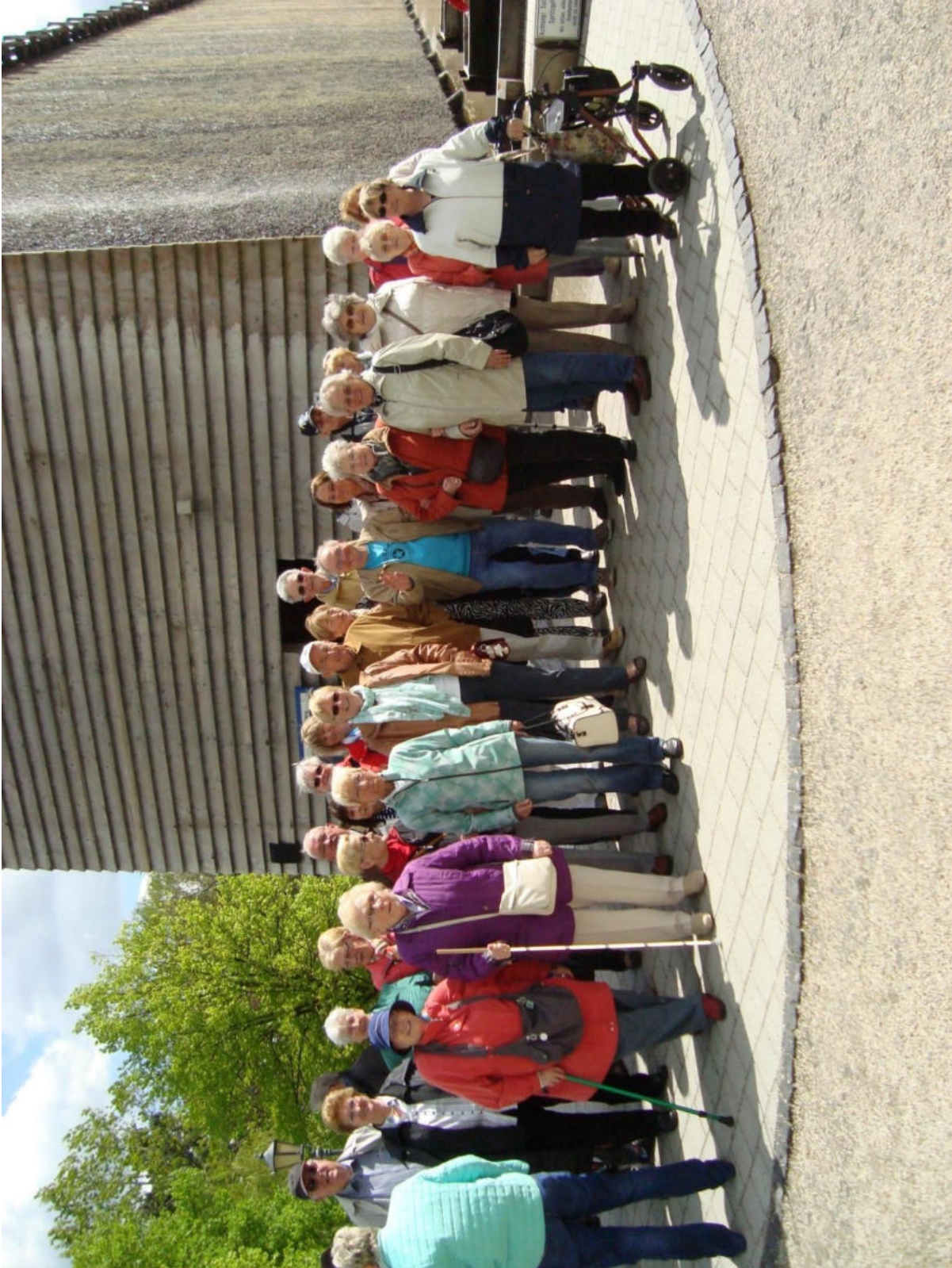
Gruppenbild der Selbsthilfegruppe C.A.L.B.