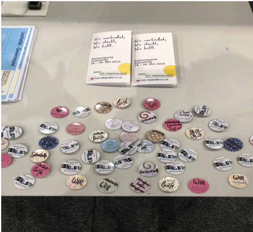
Während der Gesundheitstage haben wir fleißig Buttons hergestellt und Besucher*innen konnten sich ebenfalls kreativ ausleben!