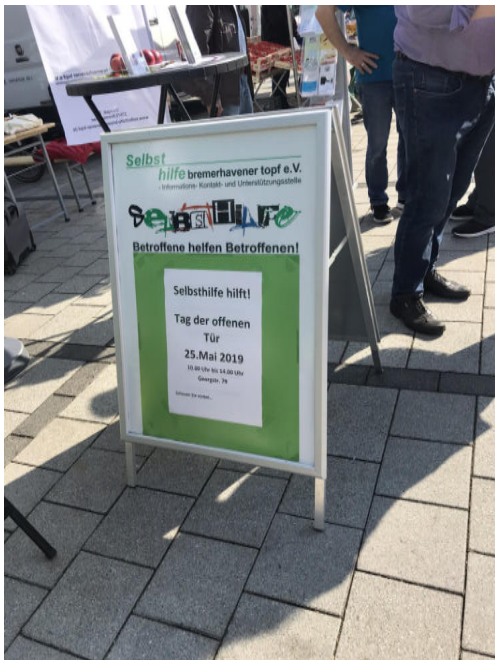
Beim Wochenmarkt in Geestemünde wurde fleißig geworben für unseren Tag der offenen Tür!