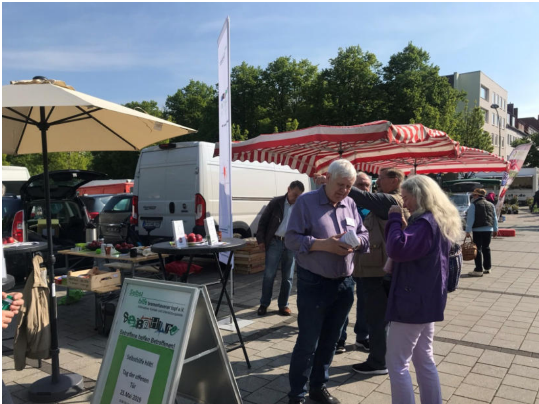
Es waren erfolgreiche Tage beim Wochenmarkt, vielen Dank!