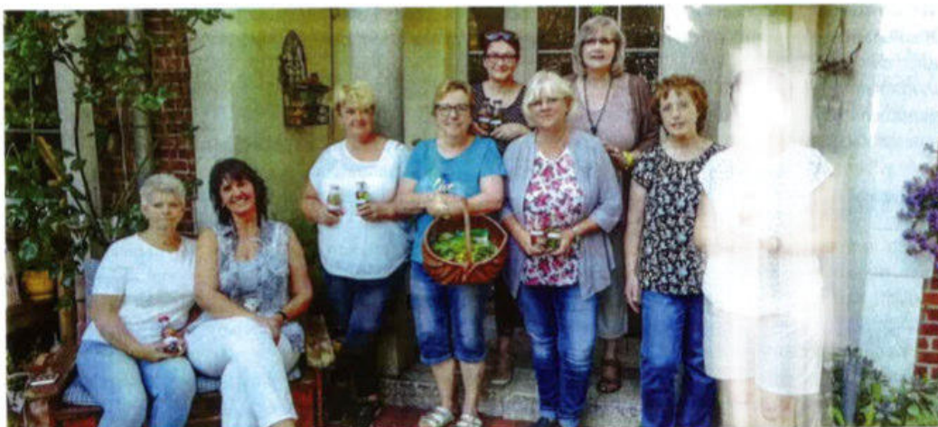
SHG Bremerhaven

Am 24.08.2019 machten wir uns mit acht Frauen aus unserer Gruppe auf zu einem Kräuterseminar. Wir waren sehr gespannt und voller Vorfreude.