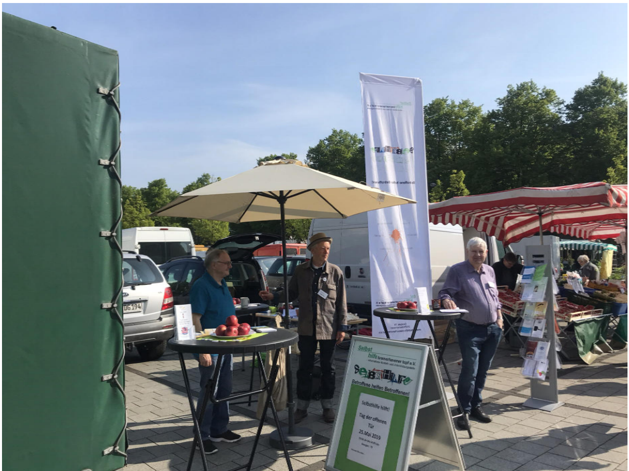
Traumhaftes Wetter hat die Tage beim Wochenmarkt nur verschönert.