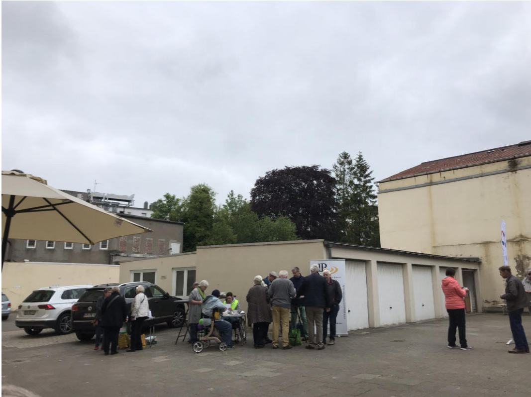
An den Tischen der Selbsthilfegruppen gibt es viel Gesprächsstoff.